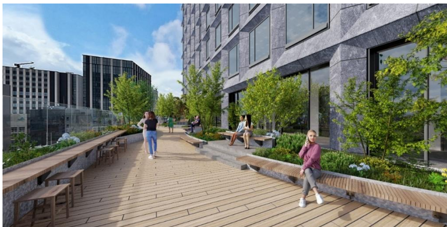
屋上庭園パースイメージ<11F>