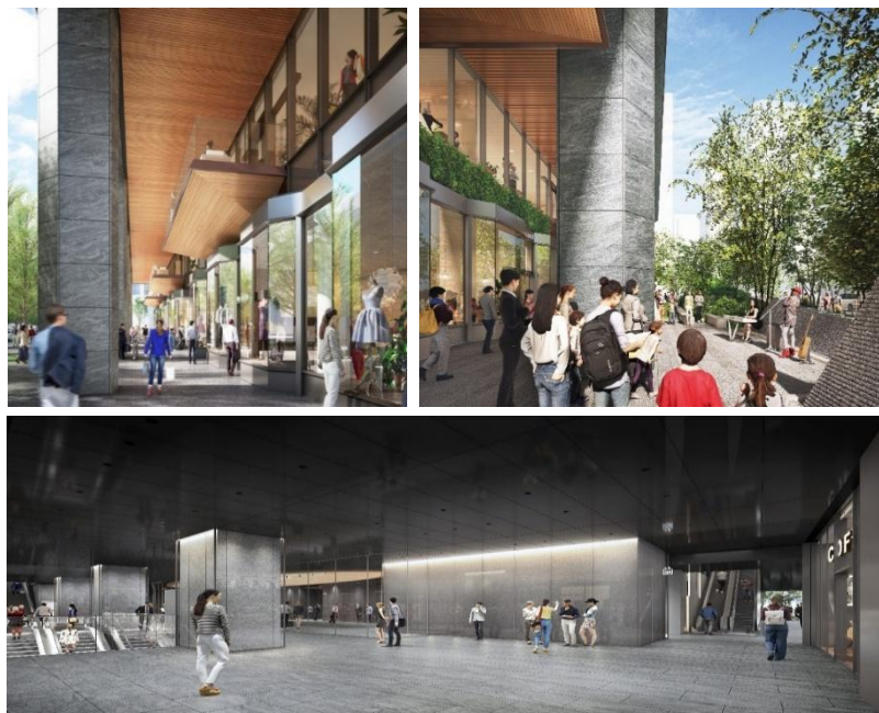
外装・内装パースイメージ<1F>