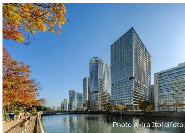
淀屋橋ゲートタワー外観

本施設は、淀屋橋駅直結という高い利便性を活かし、オフィス・商業が一体となった新たなビジネス拠点として、淀屋橋エリアのさらなる活性化に貢献します。