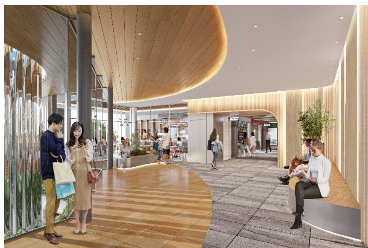
内装パースイメージ<2F>