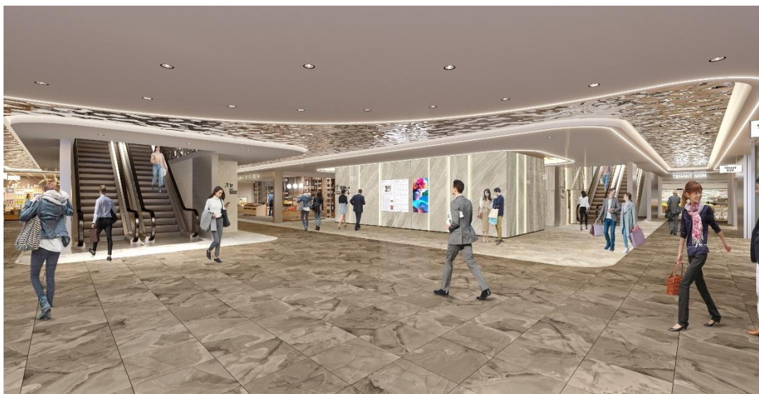
内装パースイメージ<B1F>